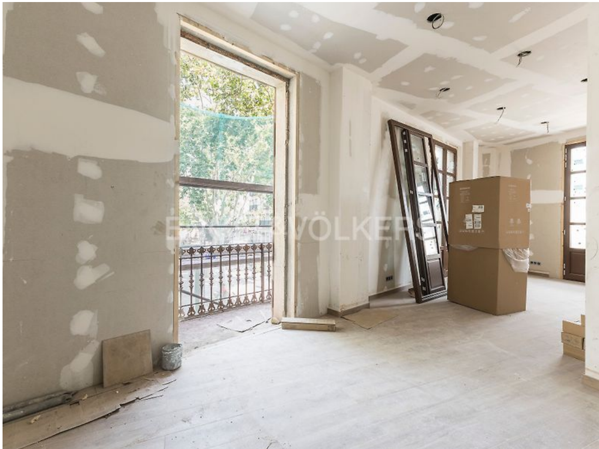
ESTADO ACTUAL, REFORMANDOSE